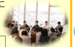
天空のほっこり カフェ演奏会(9月)

開店日：毎月第2、4木曜日 10時～11時30分 場 所：多摩養育園 本部ビル6階 らうんじ天