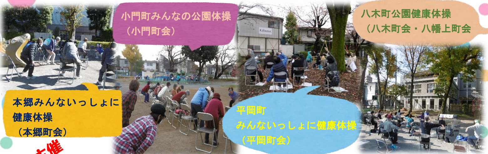
小門町みんなの公園体操 (小門町会)