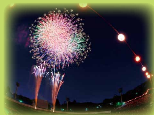
八王子景観100選「富士森公園の花火」