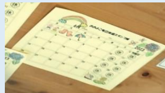
スタンプカードには ご褒美隊が綺麗に色塗り