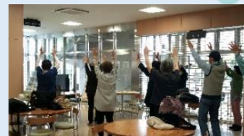
大盛況 安全管理はしっかりと