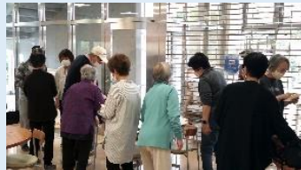
月の最終日に翌月の スタンプカードのお渡し